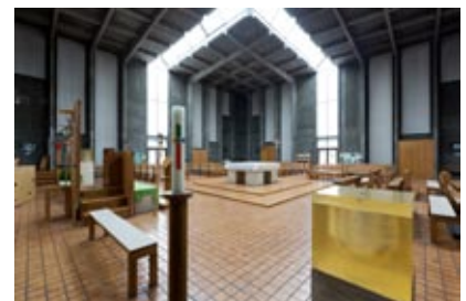
Oberbaumgarten, gut sichtbar das Dreieck Altar – Tabernakel – Taufbecken.