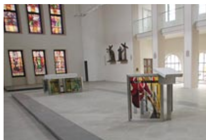
St. Gertrud mit den Altären des Wortes und des Brotes