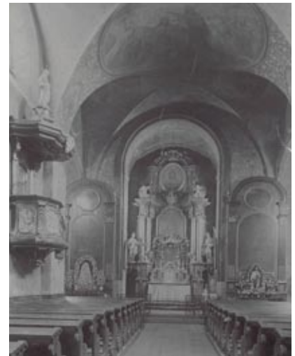
Pfarrkirche Stammersdorf um 1900